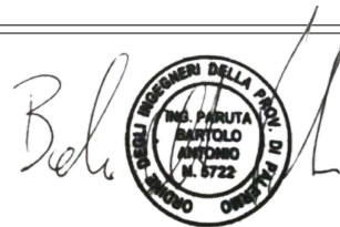
TAVOLA 5 SUB SCALA DISEGNI: DISEGNO : DATA : 13.04.2026 REVISIONE :

PRO GERACI FARM AGRICOLA SRL C.DA CORVO GERACI SICULO