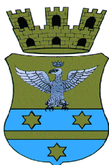
Comune di Isnello

Visita guidata virtuale del sentiero Geologico Urbano di Isnello che è stato costruito per valorizzare la Gola di Isnello, limitrofo geosito che ben rappresenta un importante fenomeno di approfondimento fluviale, che fece seguito all'evoluzione della rete idrografica madonita. La filosofia di questo sentiero geologico urbano è quella di fare risaltare il forte legame roccia-uomo presente nelle Madonie ed in particolare a Isnello, a cura del personale del punto informativo di Isnello, in collaborazione con la Proloco e la Consulta dei Giovani di Isnello. email: puntoquiparcoisnello@gmail.com