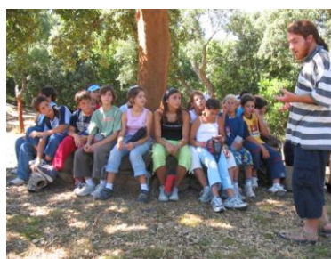
Geo & Educazione