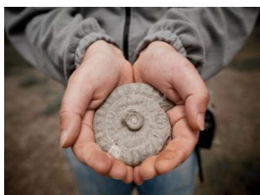
Geo & Cultura

(European & Global Geopark, con il supporto dell'UNESCO)