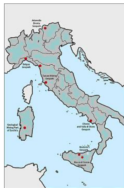
I Geoparchi in Italia