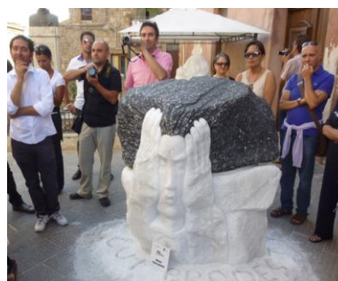
Geo & Arte