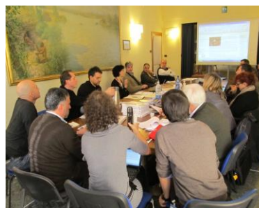
Geo & EGN/GGN

"Trovare insieme è un inizio, restare insieme un progresso...lavorare insieme un successo"