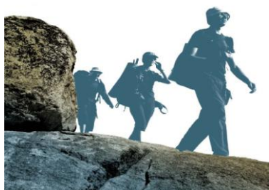
Geo & Geologia